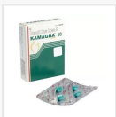
KAMAGRA-50 MG €16.00