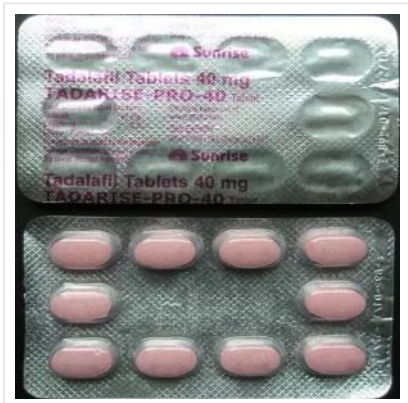
Tadarise pro- 40 mg