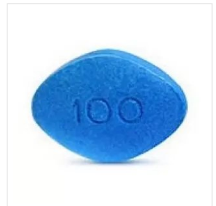
VIGRA 100 MG TAB