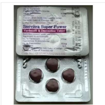
SNOVITRA SUPER POWER