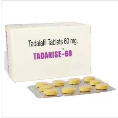
TADARISE 60 MG TAB