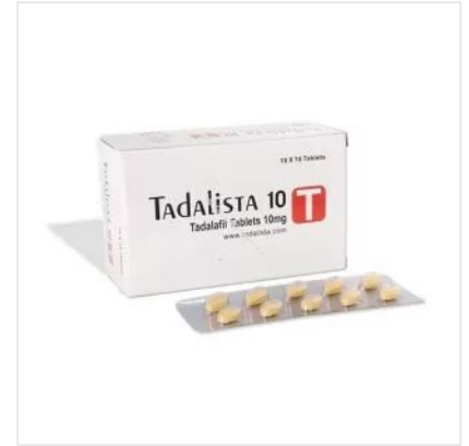
TADLISTA 10 MG