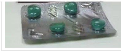
EXTRA SUPER AVANA