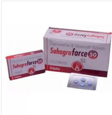
SUHAGRA FORCE 50 MG