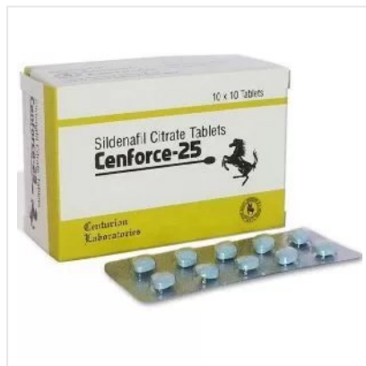
CENFORCE 25 MG