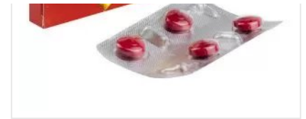
AVANA 200 MG TAB